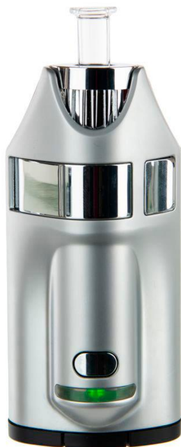
Ghost MV1 vaporizer