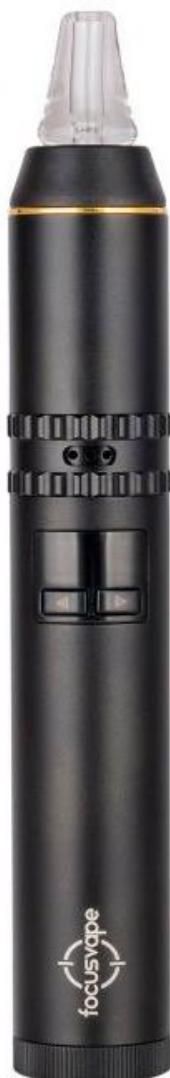
Focusvape Pro S Vaporizer black